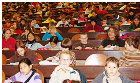
Auch in diesem Semester werden wieder rund 500 Kinder die Vorlesungen der Kinder-Universität besuchen.

Die Kinder-Universität hat den Projektstatus abgelegt und ist mit einer unbefristeten Betriebserlaubnis dem Prorektorat Lehre der Universität Zürich angegliedert worden. Von deren Zentralen Diensten erhält sie bei Bedarf kostenlos Unterstützung. Betrieb und Organisation sind jedoch nur dank Sponsoring und Spenden (z.B. Coop, Siemens, Familie-Vontobel-Stiftung) und dank dem Engagement der Dozierenden möglich, teilt die Leitung der Kinder-Universität mit.