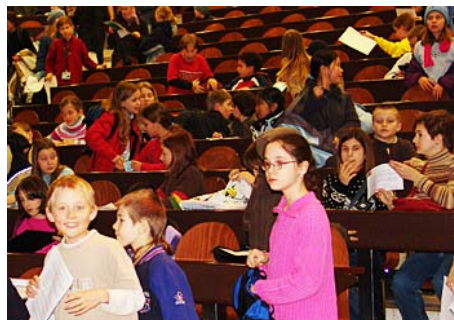
Auf Initiative eines Studenten entstand eine Projektgruppe, die in diesem Semester speziell Kinder aus Altstetten für den Besuch motivieren will und auch einen Shuttle-Transport anbietet.

Die Möglichkeit für ein Feedback bietet ein Fragebogen, den die Kinder auf der Homepage der Kinder-Universität im Anschluss an die Vorlesung ausfüllen können. Nach den ersten zwei Vorlesungen gibt es wegen der Schulferien eine zweiwöchige Pause - auf Wunsch der Kinder.